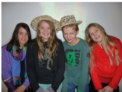
Leden Oeganda Kids Club

Wij willen door acties te houden op onze eigen school zorgen dat de kinderen van onze vriendenschool de spullen krijgen die ze nodig hebben om goed onderwijs te krijgen.